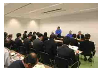
市場見学者への説明会

また、市場運営協議会を置き、市場の管理運営の円滑化を図るとともに、市場内取引の決済については共同精算システムを導入しています。