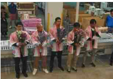
産地フェア（市場内）