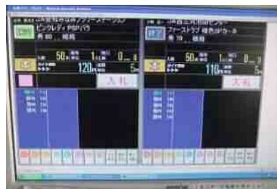
ライブオークション画面