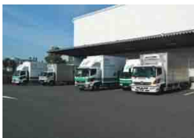
(株)名港フラワーライン(昼間)