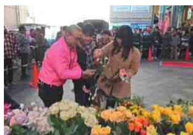
消費拡大PRイベント