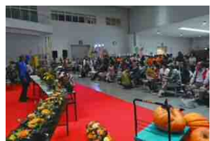
食肉・花き市場まつり