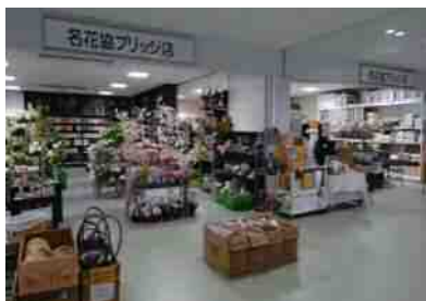
名花協ブリッジ店