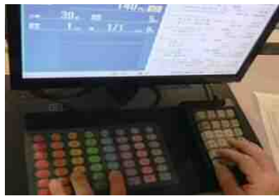
買受人用セリ端末