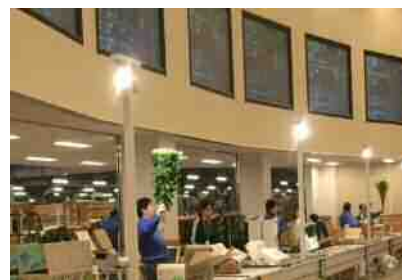
卸売場でのセリの様子