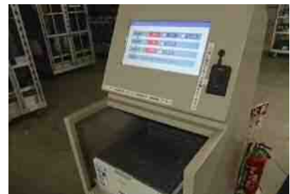
仮御買上明細書を発行します。

※詳しくは、株式会社名港フラワーブリッジ http://meikoflowerbridge.com/ にてご確認下さい。