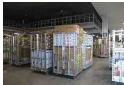
全館空調で定温管理