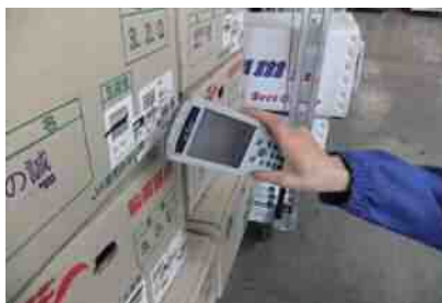
入荷時にバーコード管理