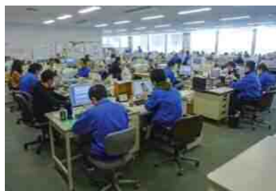
予約相対販売、注文販売