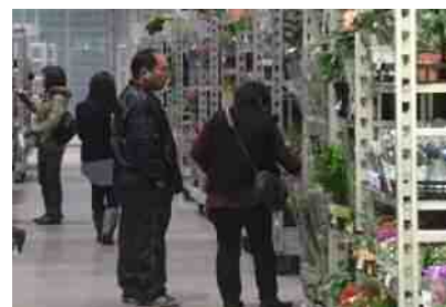
花屋さん（買受人・買出人）

お花を仲卸業者から仕入れて、小売店などで消費者に提供する人のこと。買出人となるには、手続きが必要です。