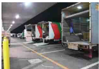
(株)名港フラワーライン(夜間)

お花の配達は、夏でもコールドチェーン(低温度帯での物流)で、途切れることなくお客様のお店まで運びます。 また、産地への集荷にもお伺いしています。